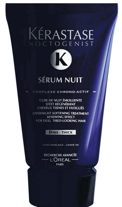
Noctogenist van Kérastase.