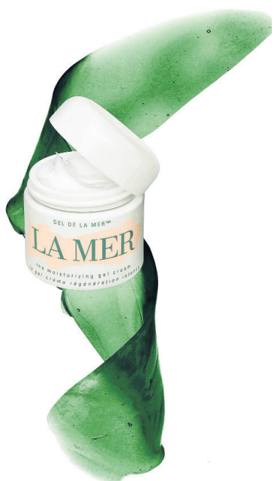
Gel de la mer.